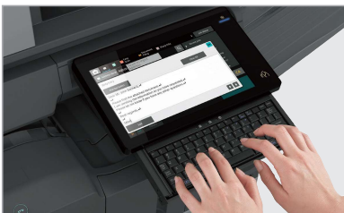
Le clavier escamotable intégré facilite la saisie de texte, d'adresses courriel et de champs d'objet.