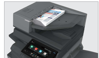
Le chargeur recto verso grande capacité 300 feuilles balaie les documents à une cadence de jusqu'à 280 images par minute.