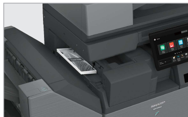
La nouvelle option d'unité de pliage interne propose une variété de formats de pliage, dont pli roulé, pli accordéon, et d'autres encore.